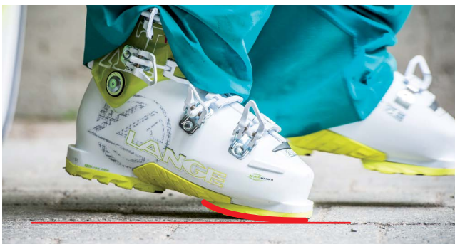
Semelle Rocker (concave) pour dérouler le pied de manière plus naturelle.

Véritable révolution dans le ski, les spatules rocker ont ouvert de nouveaux horizons aux skieurs. Aujourd'hui, ce sont les chaussures qui adoptent une forme « double spatule ». Le début d'une nouvelle ère, celle où les skieurs ne marcheront pas « carré et saccadé ». Car c'est bien d'un confort de marche dont il s'agit, aucune différence notable lorsque le skieur aura chaussé ses skis pour dévaler la pente, en revanche la forme arrondie permet de dérouler le pied de manière plus naturelle dès les premiers pas. Pourquoi n'y a-t-on pas pensé plus tôt et laissé des générations des skieurs avancer comme des robots ? Tout simplement parce que cette forme n'était pas compatible avec les normes de sécurité des fixations de ski. Le groupe Rossignol, avec son système WTR qui s'adapte aux semelles « classiques » comme aux semelles rockers, apporte LA SOLUTION.